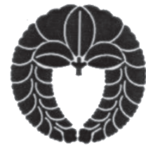
内藤家家紋「下がり藤」