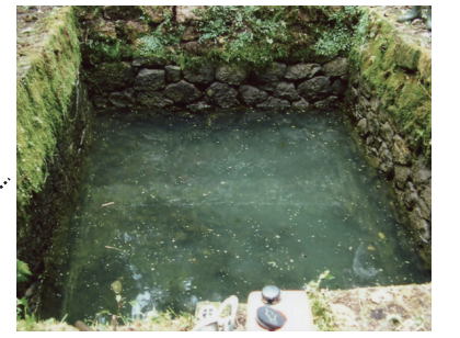
馬冷やし場(千貫井戸)