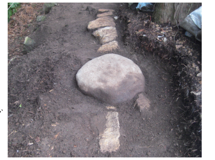
黒門跡検出柱礎石