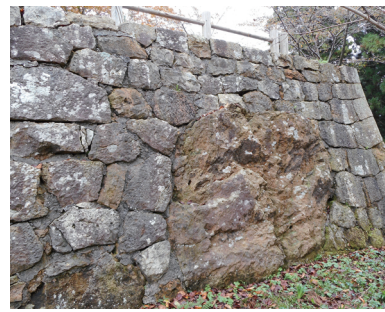
本丸入り口の鏡石