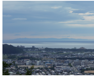
天守台から望む日本海と佐渡島