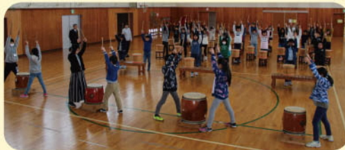
三面太鼓合同練習