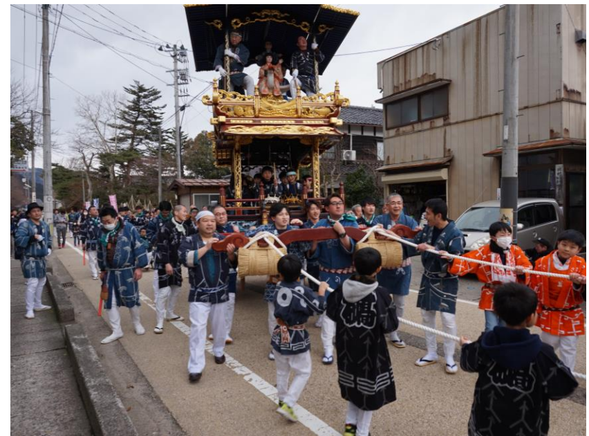
左) 大須戸能「薪能」 右) 村上まつり体験講座(昨年度)