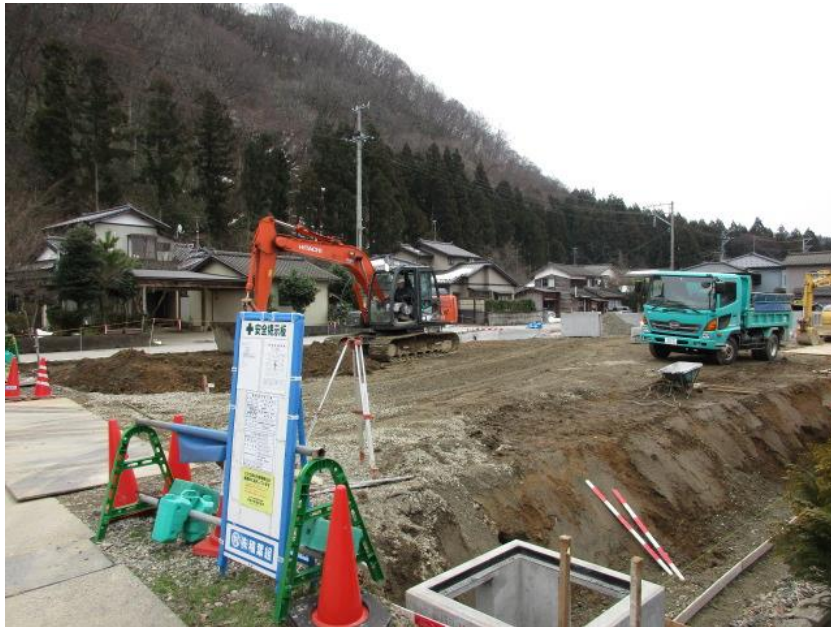
左）駐車場の整備（施工中）

実施状況： 黒門跡周辺の発掘調査 〔市生涯学習課〕 村上城跡保存活用計画の策定 〔市生涯学習課〕 駐車場の整備 （A＝1,700㎡・50台分）〔市生涯学習課〕 発掘調査現地説明会の開催 （参加者数：42名）〔市生涯学習課〕 パンフレット「村上城跡」の作成 （H31.2発行予定）〔市生涯学習課〕