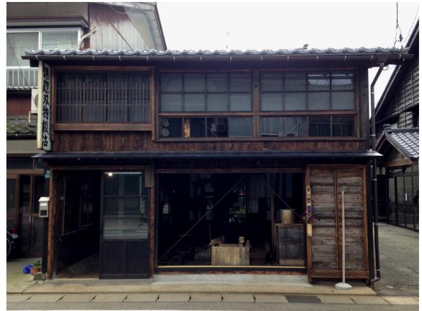
孫惣刃物鍛冶店(主屋)