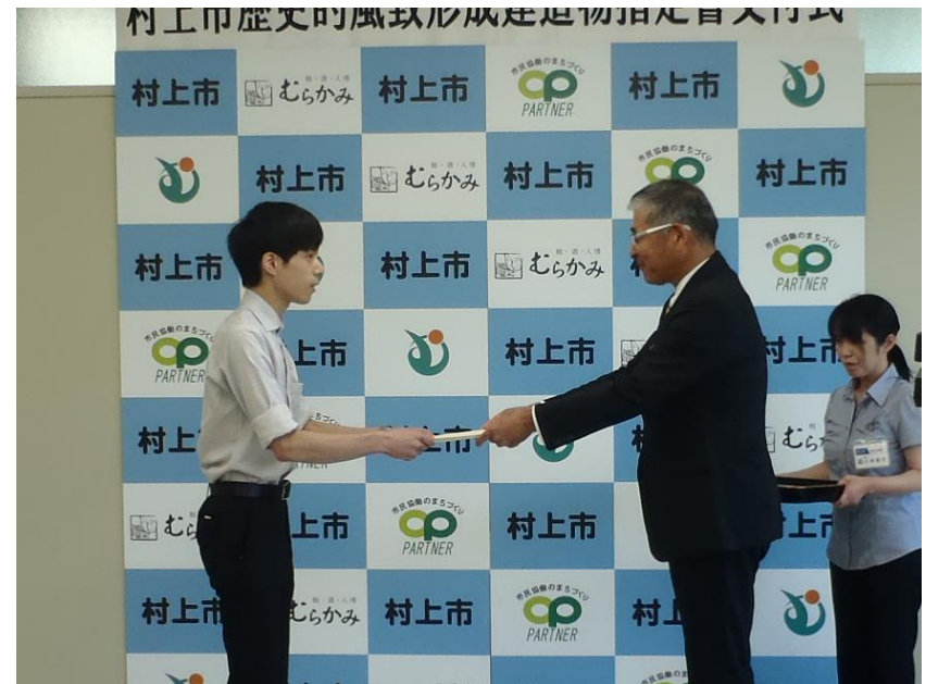
平成30年度「歴史的風致形成建造物」指定書交付式の様子