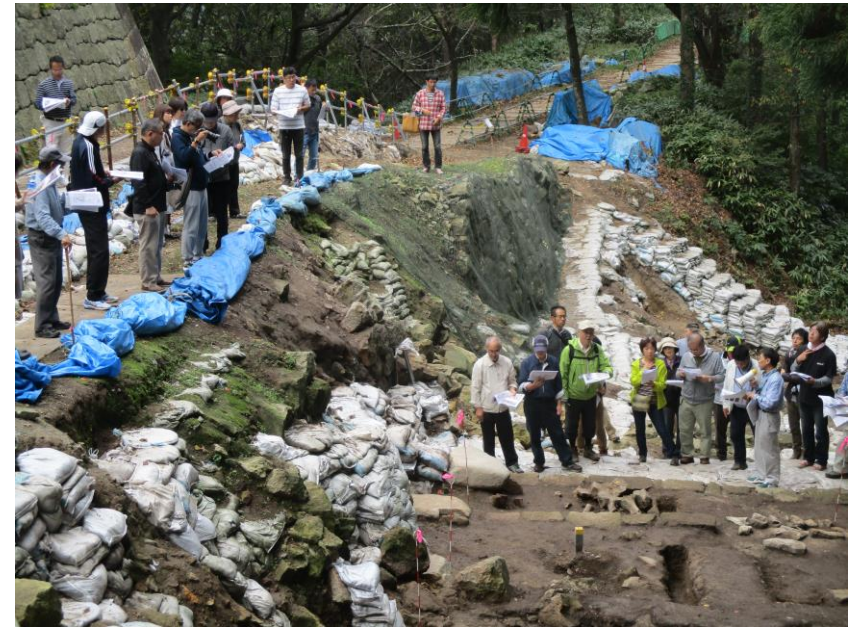
右）黒門跡周辺の発掘調査説明会