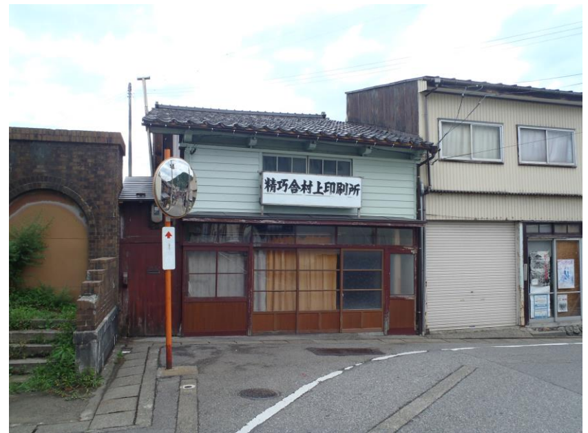
上) 九品仏(大町) 下) 旧精工舎村上印刷所(小町)