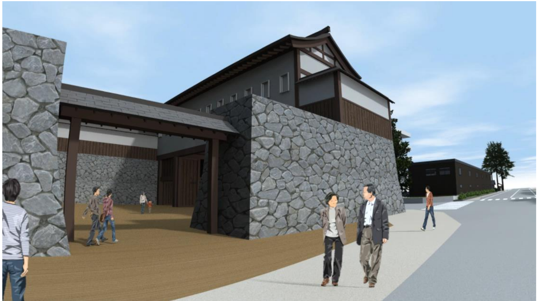
村上城追手門付近VR画像