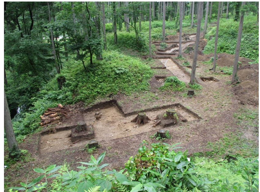
弁天虎口周辺の発掘調査