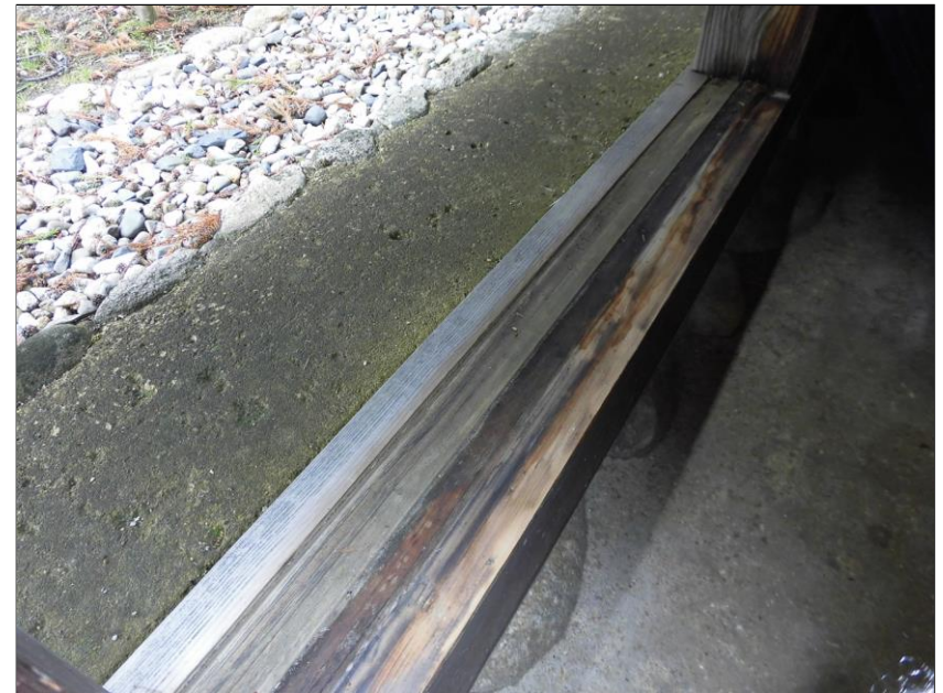
旧藤井家住宅の勝手口敷居の改修