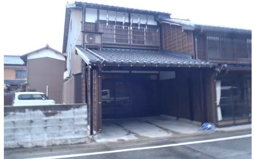
旧志田輪店(志田家住宅)(庄内町)