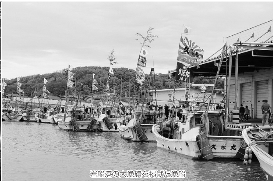
岩船港の大漁旗を掲げた漁船