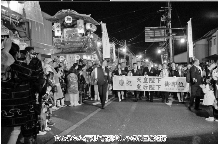
ちょうちん行列と慶祝おしゃぎり屋台巡行