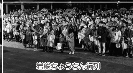
岩船ちょうちん行列