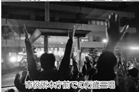
市役所本庁前での万歳三唱