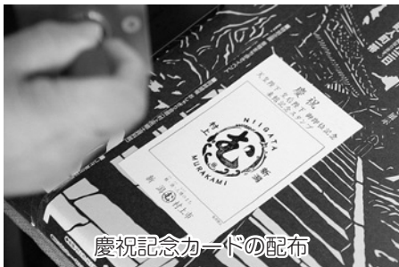
慶祝記念カードの配布