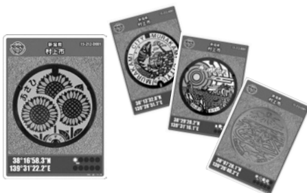
▲4種類のマンホールカード