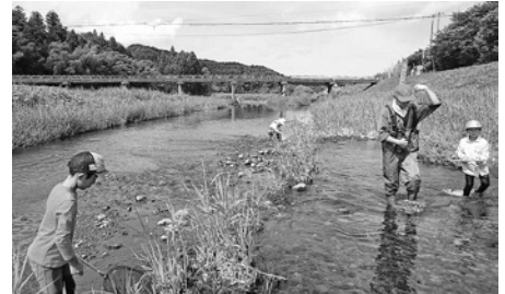
▲門前川調査隊(山辺里まちづくり協議会)

下水道に接続すると道路側溝や排水路などからの悪臭がなくなったり、害虫や伝染病の発生を防いだりして、公衆衛生が向上します。また、汚水を処理して流すことにより、海や川の水がきれいになります。下水道の大切さをご理解いただき、積極的な下水道への接続をお願いします。