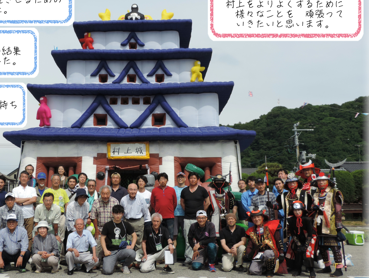
お城山フェスティバル スタッフのみなさん