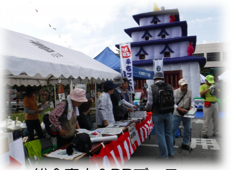
総合案内&PRブース 実施主体：村上地域まちづくり協議会地域活性部会