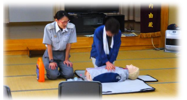
写真は馬下区での講習会の様子