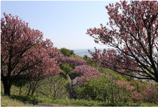
諸上寺公園の八重桜