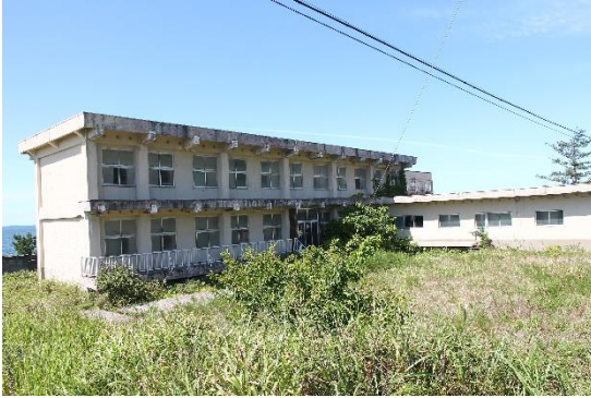
旧船員保険寮跡地