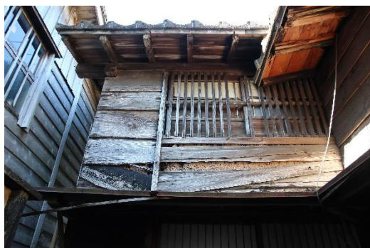
壁板の剥がれ屋根の損傷