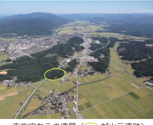
南方向からの遠景 (○が山元遺跡)