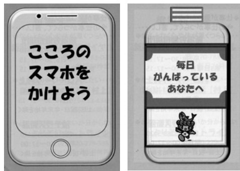
「栄養ドリンク型」「スマホ型」の2種類を作成しました。中に相談窓口も掲載しています。

自分自身が悩んだ時に気軽に相談してみましよう。また、友人や知人または家族の中で悩んでいる人がいたときに相談先として紹介できます。