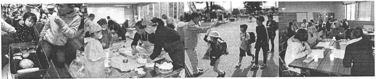
料理交流会 (燻製教室)