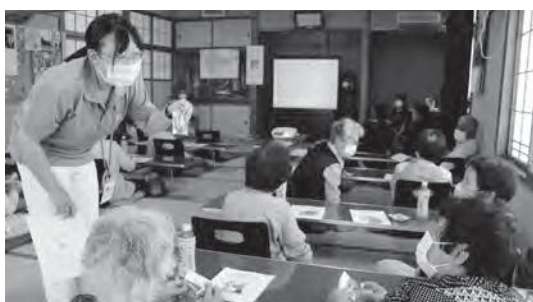
▲受講者に、認知症サポーターリングを配布しています

名割集落で、むらかみ出前講座「認知症を知ろう！」が開催さ れ、約20人が参加しました。