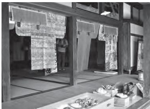
▲風に吹かれる能装束と能面

大須戸能は、新潟県無形文化財にも指定されており、様子を見に 来た集落の人も、誇らしげな表情で見入っていました。