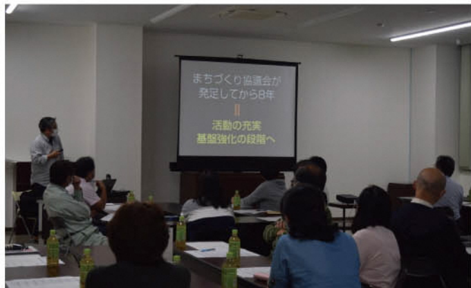
「朝日まち協研修会」