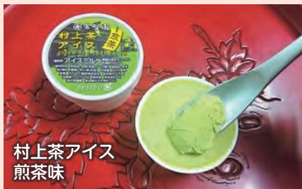
村上茶アイス 煎茶味