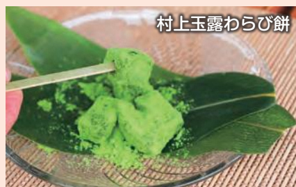
村上玉露わらび餅