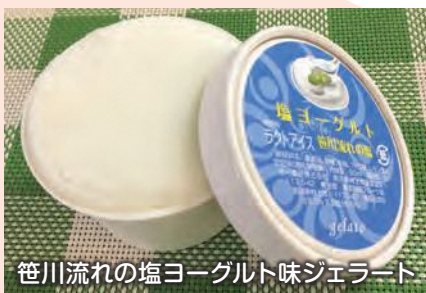
笹川流れの塩ヨーグルト味ジェラート