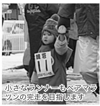
小さなランナーもペアマラソンの完走を目指します