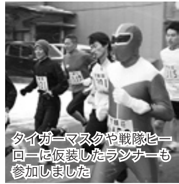
タイガーマスクや戦隊ヒーローに仮装したランナーも参加しました