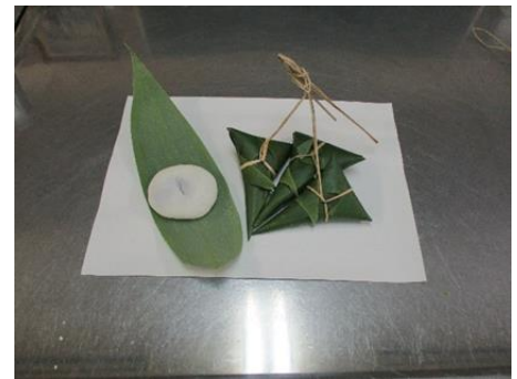
完成した「笹まき」と「大福」