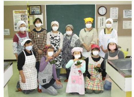
上手にできました