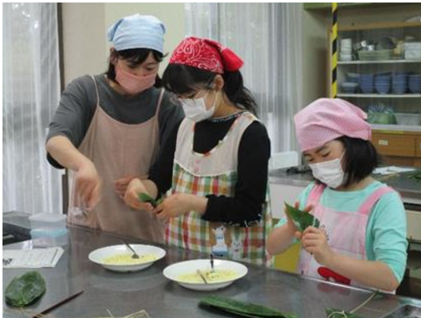
もち米を笹の葉で巻くのは想像以上に大変です