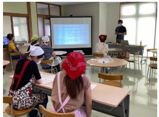
ミニ子育て講座の様子