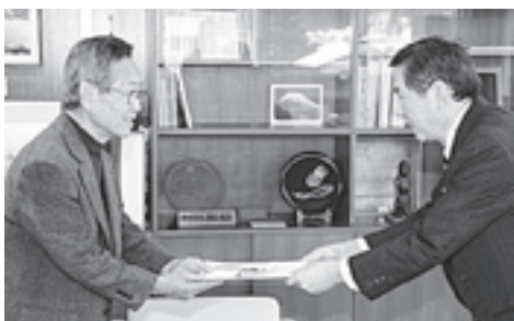
手をつなぐ育成会が障がい児のために使わせていただきます