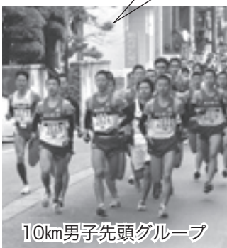
10km男子先頭グループ