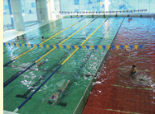
25メートルの温水プール