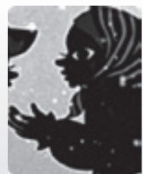
藤城清治が描く 幻想的な世界