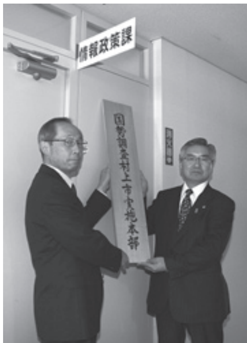
右から副市長、企画部長