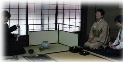
左 川崎邸の様子 右 源内塾の様子