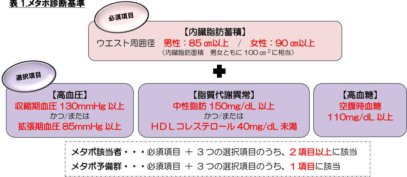
表 1.メタボ診断基準