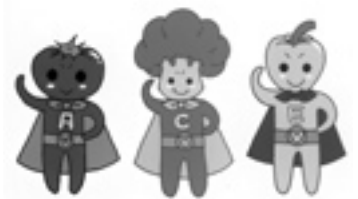
むらかみ健康応援団、びたみんACEマン♪