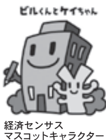
経済センサスマスコットキャラクター