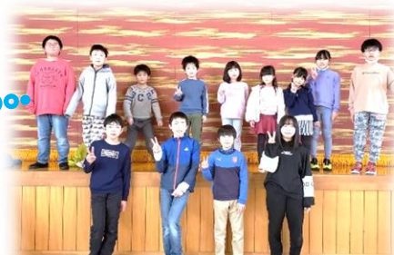
R3.2.27(土)地区子供会 ～6送会&お楽しみ会～