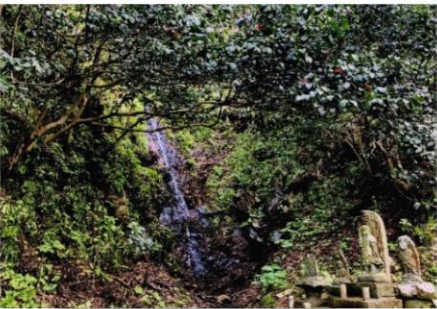
変わらぬ風景【野潟】