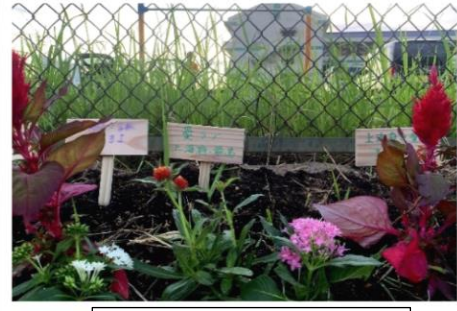
きれいになったよ【柏尾】