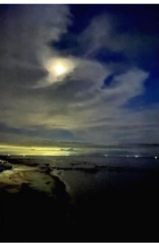
青い空が残る夜【早川】