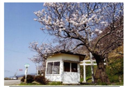
春の風景 ～岩ヶ崎～【岩ヶ崎】