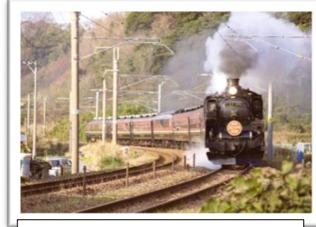
SL日本海美食旅 かもめ弁当のカーブを行く【大月】