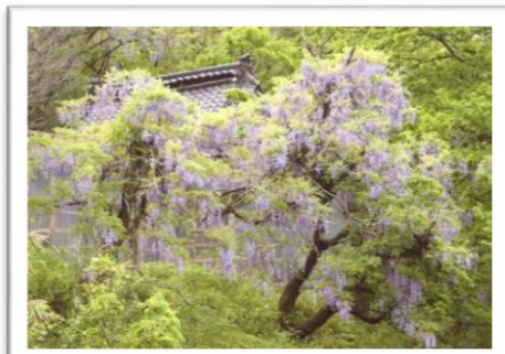
菅原神社と藤花【大月】