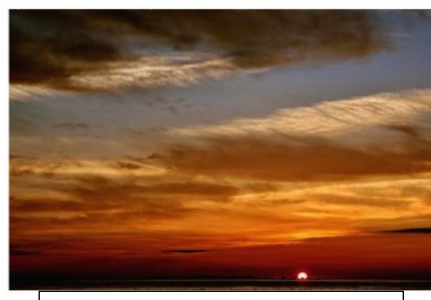
海府のマジックアワー【野潟】