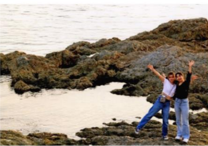
海府の夏の思い出【野潟】