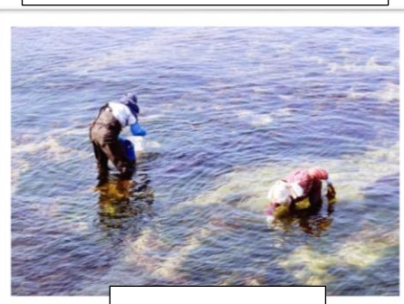
みずぬる 水溫む頃【早川】