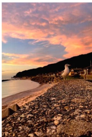
待ち望む夕食【早川】