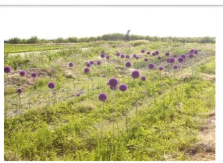
初夏の草刈り（アリウム）【大月】

応募作品は、どれも上海府の魅力が詰まっているとても素敵な写真ばかりです。そんな傑作の数々を皆さんも是非ご覧ください！