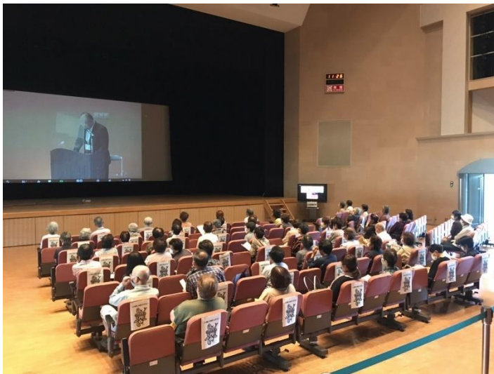
村上会場（市民ふれあいセンター）の様子