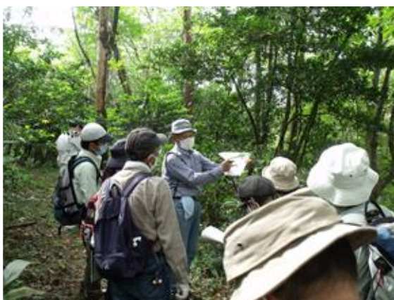
ノートも使った分かりやすい説明でした