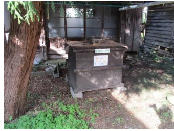
市道飯野門線沿線 (二之町～長井町間) 三之町12-11地内