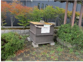
肴町山居前線沿線 (2基) (飯野三丁目～南町二丁目間) ※村高奨学会館、山居町保育園の道路向かい側にそれぞれ1基ずつ設置してあります。

10月15日発行 本紙第143号に掲載した「落ち葉集積BOX設置」の記事について、「設置場所はどこか？」とのお問い合わせを相次いでいただいております。下記の5箇所に設置しています。