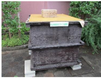
大町交差点付近 角長様脇