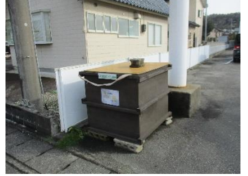
市道南線沿線 飯野一丁目 クスリのコダマ様前