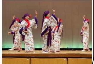
☆日頃の練習成果を存分に発揮しています☆