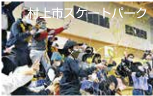
村上市スケートパーク