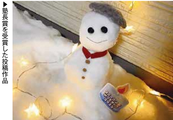
▶ 塾長賞を受賞した投稿作品

夢21・さんぽく塾が主催する山北地域の冬のイベント「スノーマンがやってきた！」。コロナ禍でも冬の賑わいを届けてもらおうと、昨年に続き制作した雪だるまをSNSなどで募集。2月12日に審査会を実施し、受賞作品を決定しました。