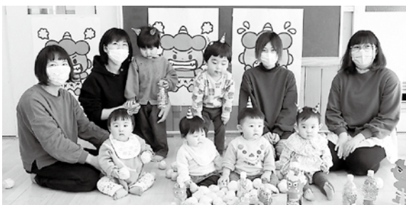
▲参加した皆さんで記念写真

節分の日、神林子育て支援センターでは今年も一年、子どもたちが健やかに成長していくことを願って豆まきを行いました。