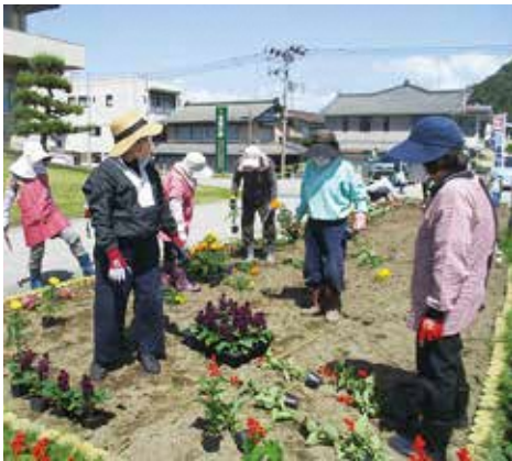
市役所前の花壇整備

また、「上海府地区町づくり推進委員会」では、村上商工会議所青年部と一緒に旧上海府小学校を活用した「上小ワンデイ復活グラウンドキャンプ」を開催しました。