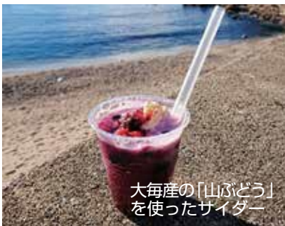
大毎産の「山ぶどう」を使ったサイダー