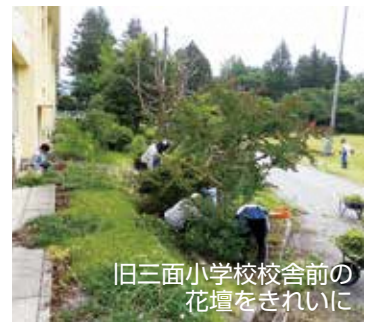
旧三面小学校校舎前の花壇をきれいに