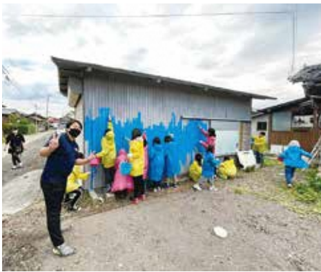
小中学生と空き家を活用した 壁画アートを製作

育援隊は、新潟県立生涯学習推進センターやSDGs・地域づくりなどを研究している新潟大学の村山研究室と連携し、地域課題である空き家を活用した活動拠点「おらだり基地」を開所。ここでは、地域の子どもや大人が集い、