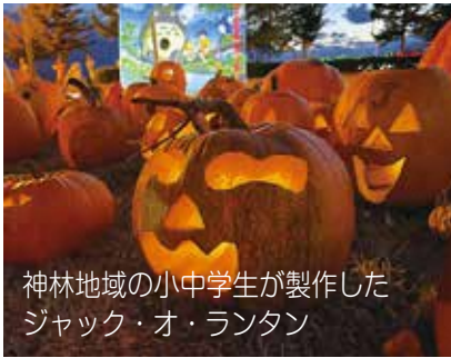
神林地域の小中学生が製作したジャック・オ・ランタン