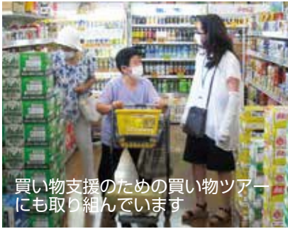
買い物支援のための買い物ツアーにも取り組んでいます