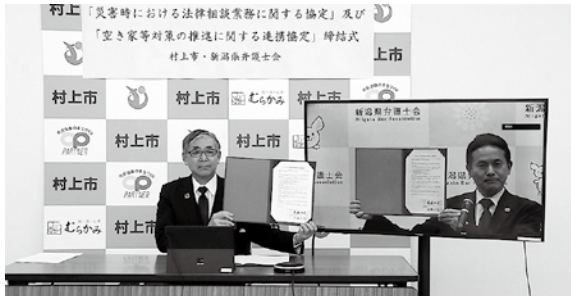
▲オンラインにより協定を締結

「災害時における法律相談業務に関する協定」「空き家等対策の推進に関する連携協定」(市役所)