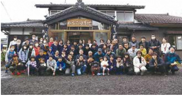
おらだり基地オープニングイベント