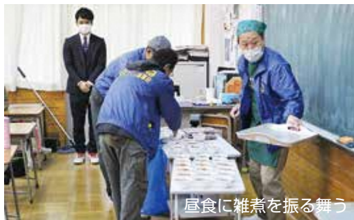
昼食に雑煮を振る舞う