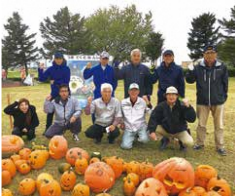
神林地区関係人口創出事業実行委員会 の皆さん

令和2年度には、人口減少に伴う担い手不足の解消を目的に「神林地区関係人口創出事業実行委員会」を立ち上げ、道の駅神林を拠点に、関係人口(※)を増やそうと取り組んでいます。