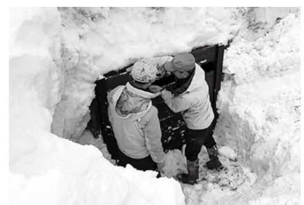
▲蔵出しは4月24日の予定

4月24日に開催予定の蔵出しイベントは、現在、参加予約を受け付け中で、中止となった場合は自宅へ配送する予定。雪解けの春を感じながら、まるやかなお酒を味わってみてはいかがでしょうか。