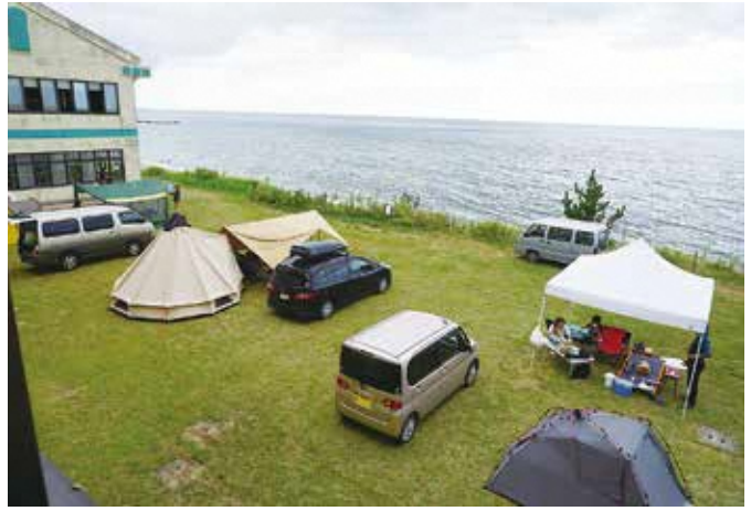
「上小 ワンデイ復活 グラウンドキャンプ」 キャンプサイト