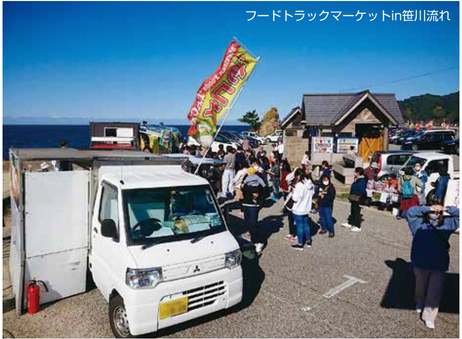
フードトラックマーケットin笹川流れ