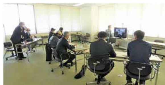
▲これからの農業を真剣に考える若手農業者たち

村上市の次代を担う若手農業者6名と北陸農政局新潟県拠点村上市神林支所を会場にオンラインで意見交換会を行いました。