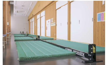
トレーニングコーナー(スラックライン)