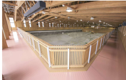
ランニングコース(1周170m)