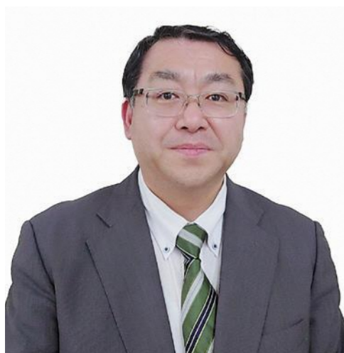
第2期村上市地域福祉計画・地域福祉活動計画策定委員会

今後は、この計画が村上市の地域福祉向上の羅針盤となり、市民お一人お一人に浸透し、福祉活動につながり、基本理念にある「みんながつながり支え合うまち村上」が実現できるよう期待いたします。