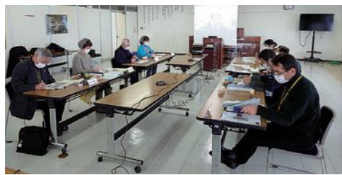
▲第3回委員会の様子