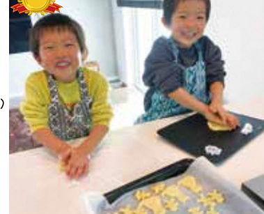
「がんばってるね賞」