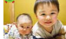
「2人ですると楽しいね。」