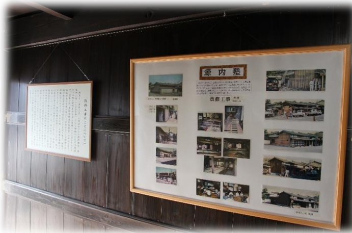
③源内塾入り口入ってすぐの壁面（左側の看板） 令和3年3月頃完了した施設の改修工事についての説明です。右のパネルは以前からある、昔行った有志による修理の時の資料です。