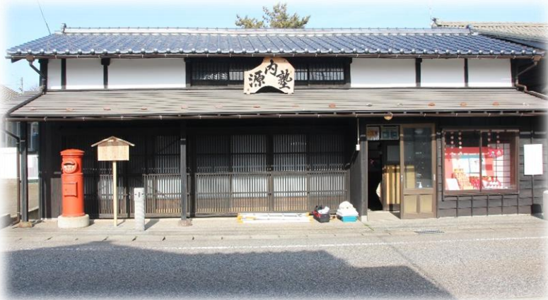
①源内塾正面に設置した高札型看板

まちづくり協議会では、源内塾のさらなる利活用振興の為、施設内に源内塾の歴史と概略を示す各種看板を設置しました。施設を初めて利用する方でも源内塾に非常に歴史的価値があること、岩船になじみ深い施設であることが分かる内容になっています。利用の際は是非ご覧ください。