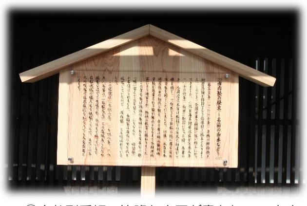
②高札型看板 簡略な来歴が書かれています。