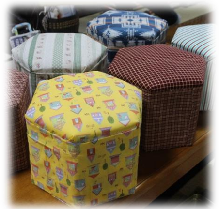
昨年のお茶の間で作った牛乳パックの椅子