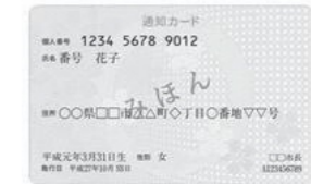
上: 通知カード(表面)