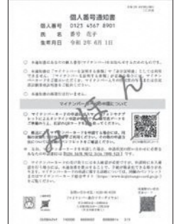
右: 個人番号通知書