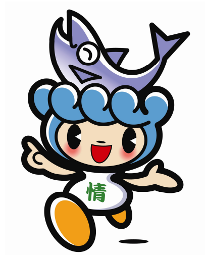
村上市観光キャラクター 「サケリン」