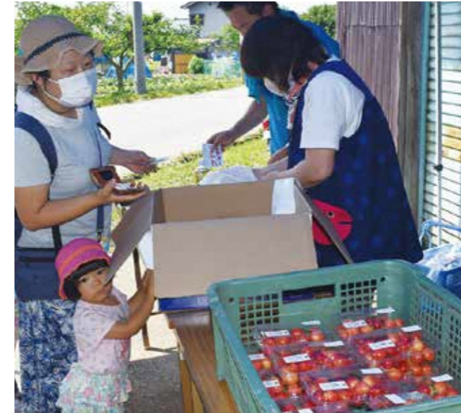
さくらんぼ直売は大好評！

僕自身も3年ぶりにこのステージで歌う事が出来て本当に良かったです。皆様本当にありがとうございました。