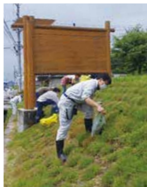
芝桜の整備をして

道の駅朝日の向かい、国道を挟んだ猿沢の法面の芝桜。植付けから3年が経ち、今年はきれいなピンク色のじゅうたんが目を惹かせてくれました。 芝桜とともに雑草も元気に伸びてきたので、生活安心部会のメンバーで草取りをしました。なかなか急な法面です。芝桜を踏まないように、自分が滑り落ちないように踏ん張りながら、無事に草取りが終わりました。また来年もきれいに咲いてくれますように。 「猿沢の花」芝桜もだいぶ増えてきました。