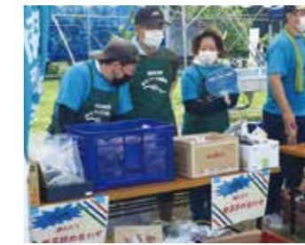
▲朝採れ野菜も格安販売！