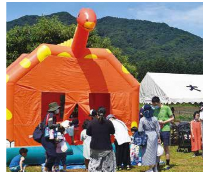
子どもに人気のふわふわ遊具