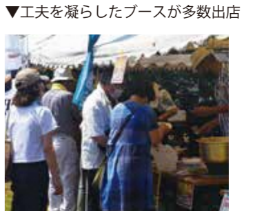
▼工夫を凝らしたブースが多数出店