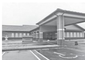
医療法人 佐藤医院 (猿沢2221番地) ☎60-2221 https://satomed.or.jp