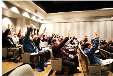
☞ 通常総会での議事の様子