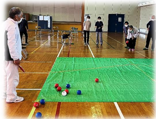
白熱したゲームが行われています！