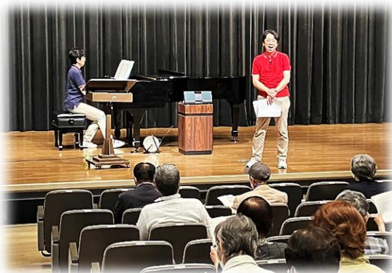
受講生のハーモニーが会場に響きました

29日（月）には、パートⅡとして、「思わぬ発見と、日常生活に役立つことを学ぶ」をテーマに、音楽講座と防災講座を行いました。