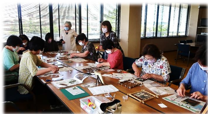
夢中になって作品を作っています