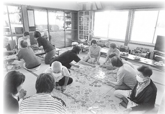
藤沢集落で実施した茶の間

ながら頑張ることができた」などの声を聞かせていただくことができ、笑顔あふれる茶の間の訪問となりました。 参加した隊員も、「集落の人々の結びつきや助け合いが強く残っていること感じた」と話していました。 今年度は、隊員同士での勉強会を行い、ささえる隊員について知識を深める予定としています。そして、荒川地域の皆さんと共に考えながら、活動を行っていきます。