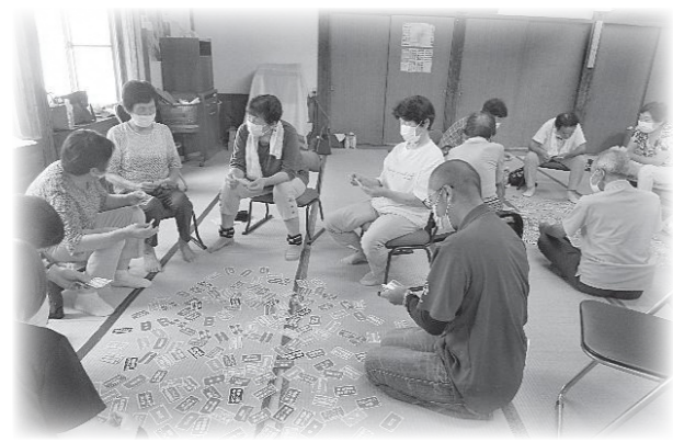
下鍛冶屋集落で実施した茶の間

あらわ互近所ささえる隊は、昨年度に引き続き、各集落の地域の茶の間などを訪問し、ささえる隊の周知や地域の実情の聞き取りを行っています。今年度は、昨年8月の水害により被害の大きかった下鍛冶屋、藤沢集落を訪問し、お話を伺いました。 参加者からは「買い物や除雪、季節の野菜のやり取りなど集落内での結びつきがあり、水害の時も声を掛け合