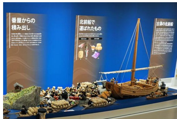
北前船の展示コーナー