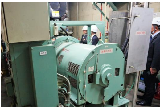
消化ガスコージェネレーション設備