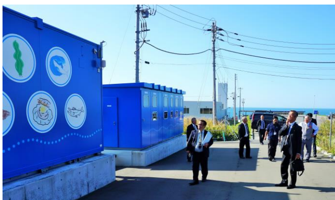
マイクログリッドシステム

田地区に完成した。本システムにより太陽光による再生電力を近隣の5つの公共施設へ供給し、災害時（停電時）には蓄電池と水素による電力を指定避難所である厚田学園の体育館に供給する。