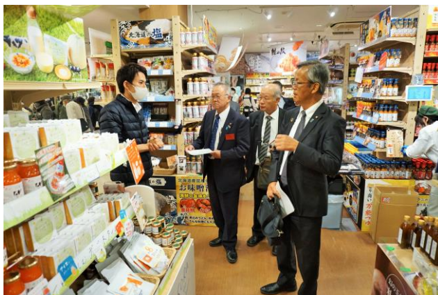
多くのオリジナル商品が陳列されている店内

「物産コーナー・農産物直売所」「グリルレストラン」「フードコート」「コンビニエンスストア」の4つのエリアで構成されており、物産コーナー・農産物直売所は、約2倍