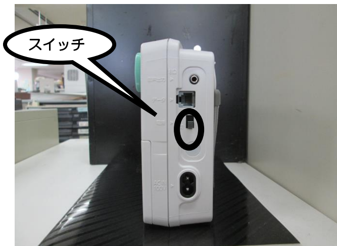
【電源スイッチ】(戸別受信機右側側面)