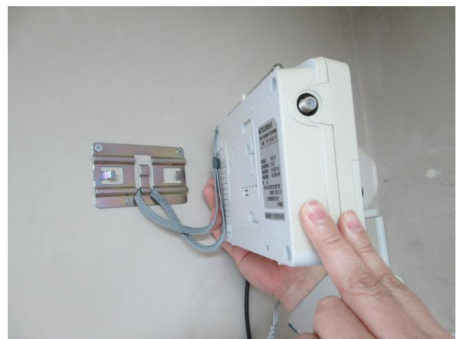
ストラップを中心部に引っ掛け、受信機を取り付ける。