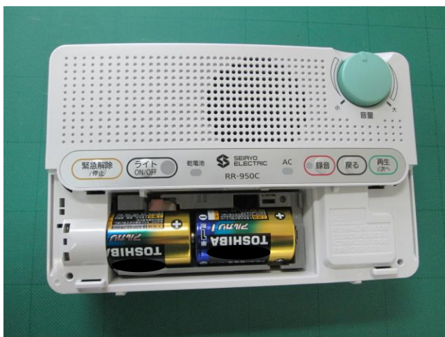
乾電池を2本交換してください。 単一アルカリ乾電池をおすすめします。