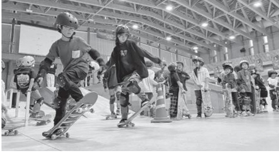
▲子どもたちの真剣に取り組む姿

4回目の開催となった今大会は、初心者体験教室やミドルクラススクールで練習に励む子供たちなどを対象に開催し、県内外から134人のスケーターが参加して、日ごとの練習の成果を競いました。 初心者の子どもたちが速さを競う「チクタクレース」や中・上級者による本格的なストリートとパーク種目の競技が行われた会場は、予想をはるかに超えるハイレベルな勝負が繰り広げられ、大いに盛り上がりました。