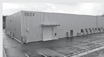
増設竣工した第4工場

航空機業界はコロナ禍も明けて大きく羽ばたき始めています。私たちと一緒に働き、航空機などの安全な運航に貢献しませんか。