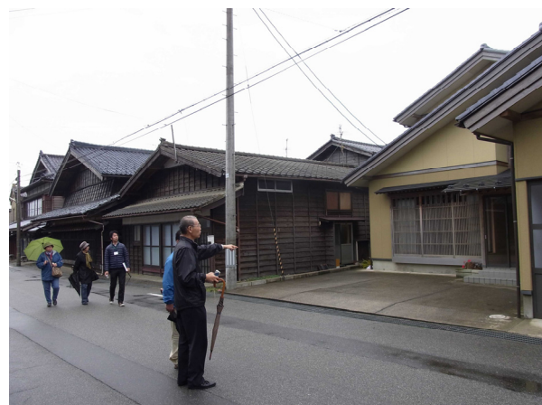
景観についての知識を深めるためのまちあるきの様子（景観懇談会）