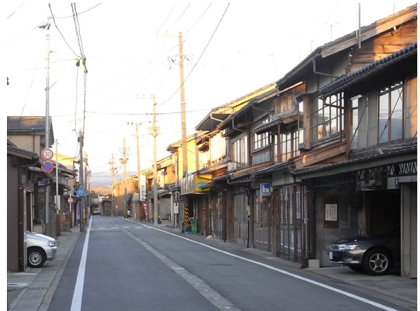
歴史的建造物によるまち並み（庄内町）

城下町や宿場町等の歴史的価値の高い集落やまち並みの保存・活用を図るため、文化庁や教育委員会による助言・指導を行うとともに、修理・修景事業や防災設備・案内板の設置等に対する支援を行う制度です。