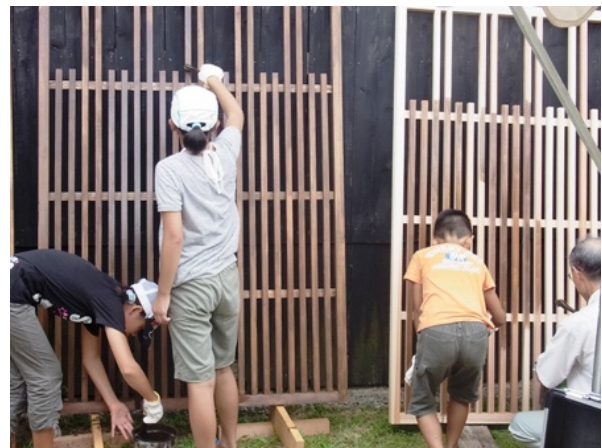
住民による出格子製作の様子（塩谷地区）