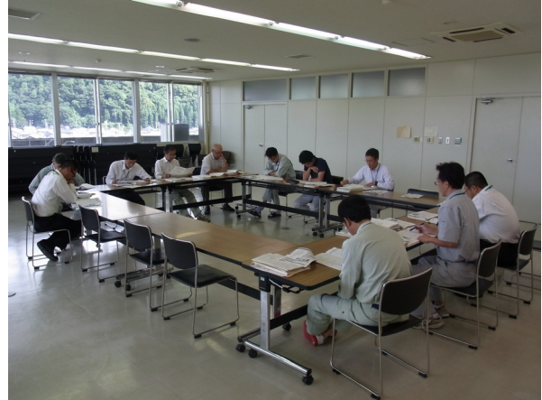
景観計画策定時の検討委員会（庁内）の様子

また、公共施設等の整備においては、各部署で行われる景観形成行為等について、確実に計画に沿って行われるような体制の構築を図ります。