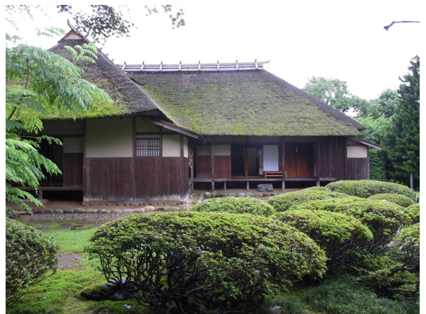
国指定重要文化財の若林家住宅

歴史的価値の高い環境を維持・向上させるため、歴史的風致を形成する建造物の復元や修理等のハード面と、そこで行われる人々の活動といったソフト面の両面にわたる取り組みに対して、総合的に支援する制度です。