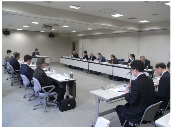
景観計画策定時の策定委員会の様子