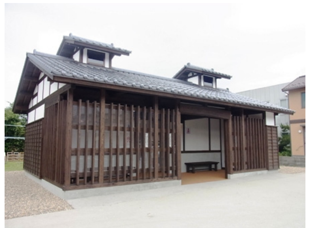
景観に配慮して整備された上町の公衆トイレ

公共施設の整備に際しては、重点地区において優先的に実施していくとともに、道路空間における無電柱化の検討や道路付属物の色彩配慮など、公共空間における十分な景観配慮に努めます。