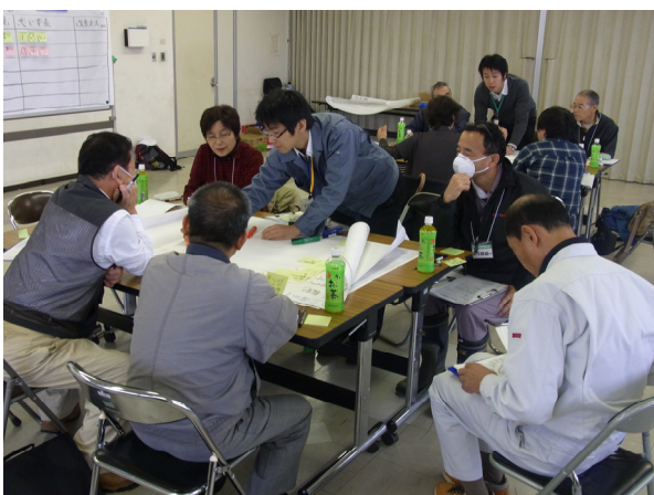
景観についての議論等を行った市民ワークショップの様子（景観懇談会）

まちづくり協議会をはじめとする各地域の協議の場等において、景観づくりに関連する活動を進めていけるよう、各地域のリーダーを育成するための取り組みを実施します。