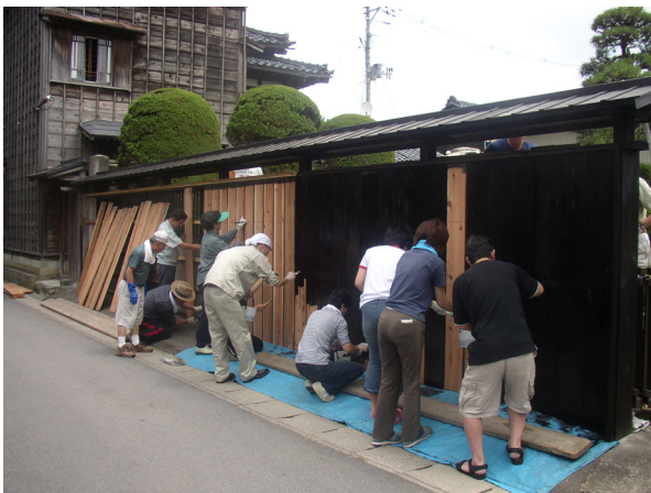
住民による黒塀製作の様子（安善小路）

そのため、地域の主役である市民が主体となり、建築をはじめ景観づくりに直接携わる事業者が協力し、様々な支援策を通じて行政が後押しする、三者の協働による景観づくりに取り組んでいきます。