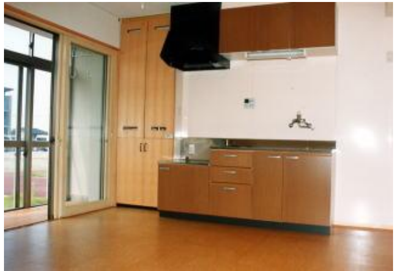
【左:サンルーム、中央:ダイニングキッチン】