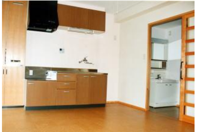
【ダイニングキッチン(台所兼食事室): 12畳】