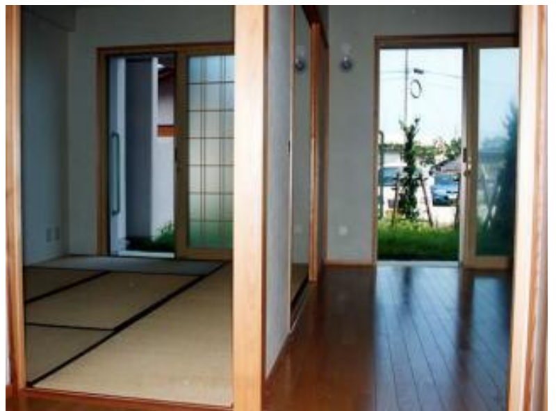
【左:和室6畳、中央:引き戸、右:洋室6畳】