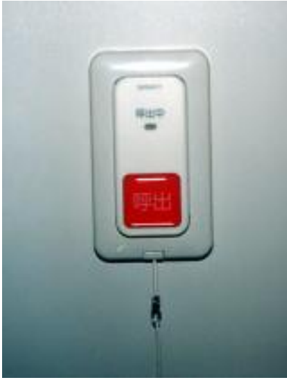
【非常呼出しボタン】