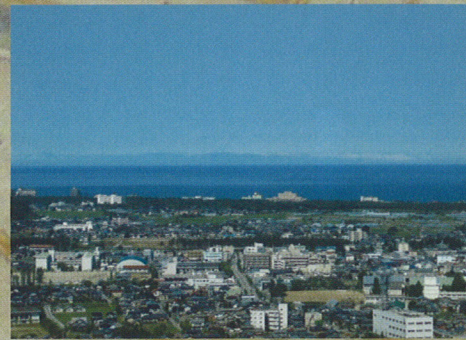
天守台から望む佐渡ヶ島

とくに、満開の桜に彩られる春、澄みきった空気のもと、佐渡を一望にできる秋の景色などは、すばらしいと言うほかありません。また、今も街の随所に、旧武家屋敷、枡形跡、鉤小路などが見うけられ、かつての15万石の城下の繁栄のよすがとなっています。