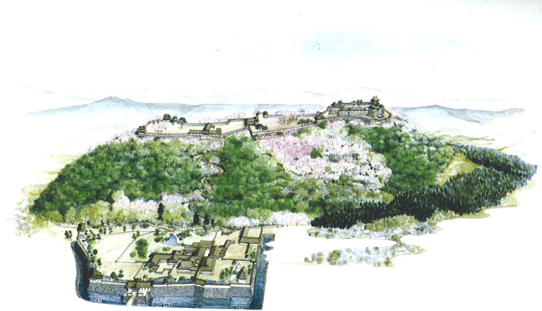
村上城復元想像図