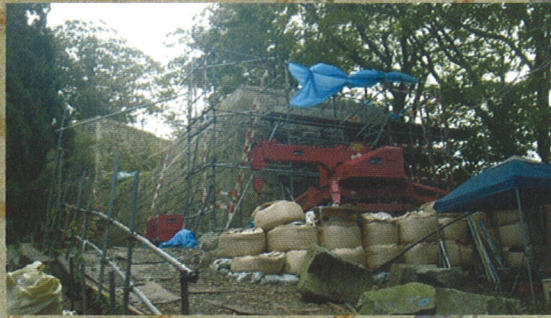
修復中の出櫓台石垣

越後（新潟県）北部の中心的存在であった村上城は、標高135mの臥牛山、通称「お城山」に築かれた梯郭式の平山城です。本丸、二の丸、三の丸、山麓の城主居館跡から成り、鎌倉時代、坂東八平氏の出自である小泉荘地頭職の小泉氏を祖とする本庄氏が16世紀初頭に築城した中世城郭が原型です。本庄氏は、繁長（1539～1613）のときに