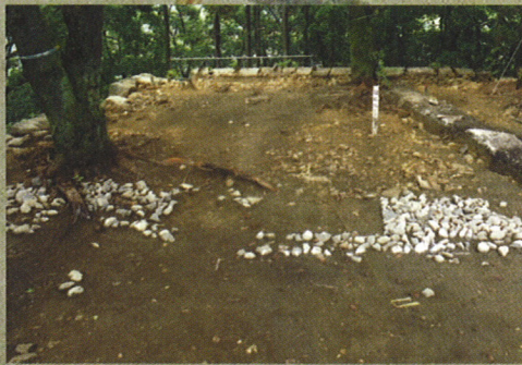
発掘調査が行われた櫓跡

天正18年（1590）、当時天下を手中にしつつある豊臣秀吉により、天正16年の庄内出兵を私戦禁止令違反に咎められ、繁長は改易され、村上城は、直江兼続の弟である大国実頼の預かりとなり、春日元忠が城代として入ります。このころ作成された『瀬波郡絵図』に、村上城は、「村上ようがい（要害）」として描かれており、当時、既に城下町が形成されつつあり、山上には多くの建物があったことがわかります。その後、村上城には村上