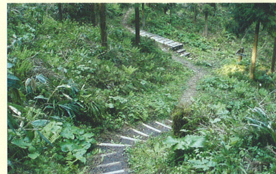
中世遺構散策コース