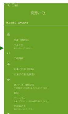
種類別の情報を詳細に表示