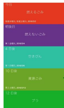
アプリのトップ画面