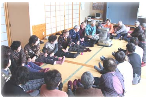
よいしょ、よいしょ