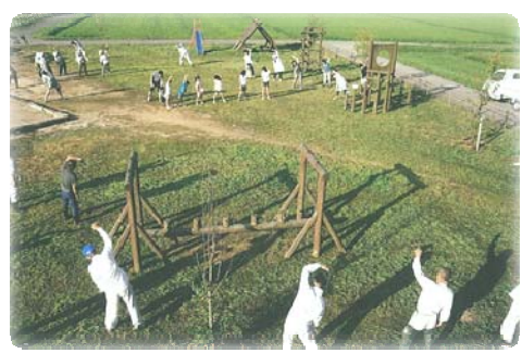
ラジオ体操第一！ よーい！

を行なっています。普段顔を合わせる機会が少なくなっているなかで、体操をつうじて交流を深めることが出来ました。