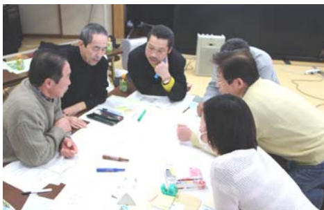
災害が発生した場合を想定して、話し合いを行いました。皆さん真剣な表情です。