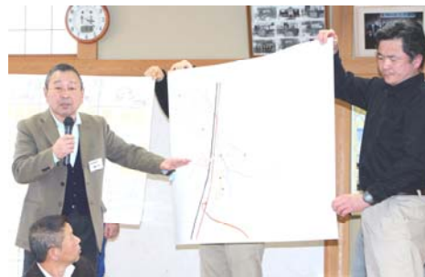
集落の地図をもとに災害図上訓練を行いました。地域の特徴を再確認しました。