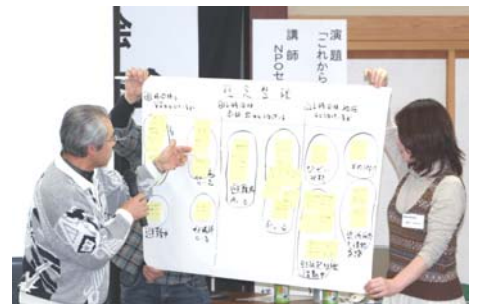
集落毎に行ったワークショップで話し合った結果を発表しました。